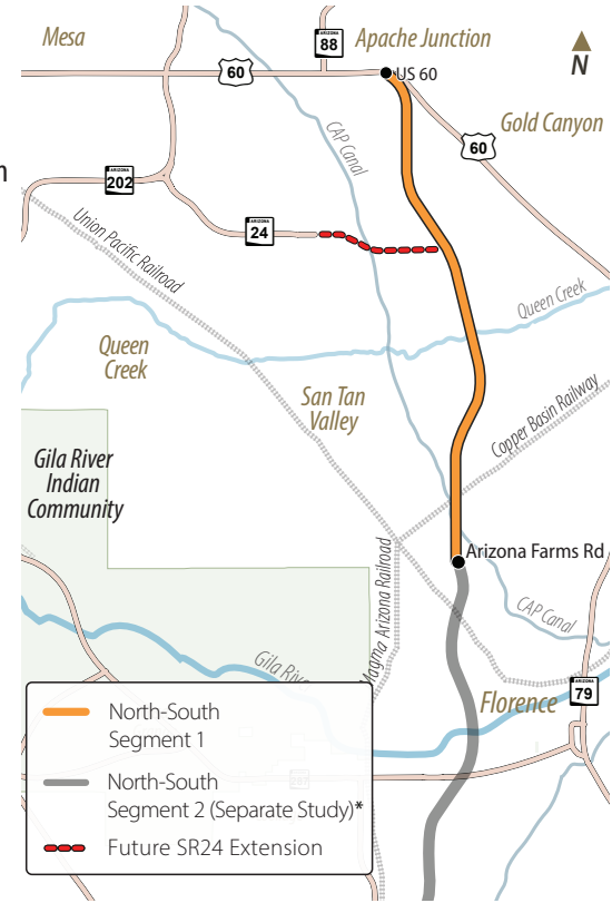
*North-South Segment 2 is a portion of the full Tier 1 North-South Corridor and will be evaluated as a part of a separate study.