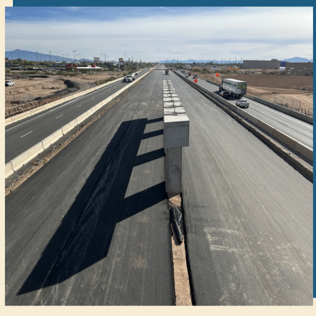
Pavimentación del mediano a lo largo de la I-10 como parte de la ampliación de la I-10.