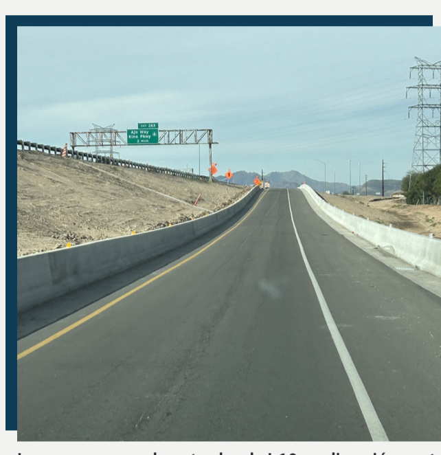
La nueva rampa de entrada a la I-10 en dirección oeste en Alvernon Way está terminada y en funcionamiento