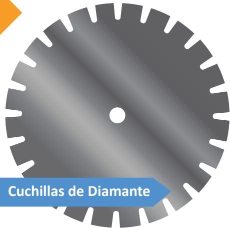
Cuchillas de Diamante

Las cuchillas de diamante estrechamente espaciadas eliminan aproximadamente \frac{1}{4} de pulgada de una fina capa de la superficie de la carretera.